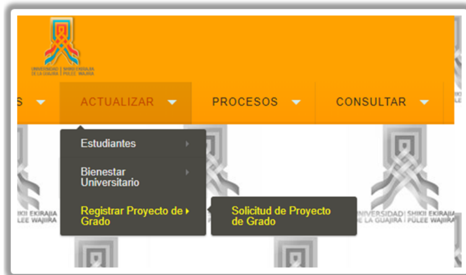
Figura 2. Ruta