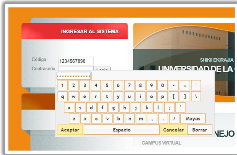
Figura 1. Inicio de sesión en Mi Campus